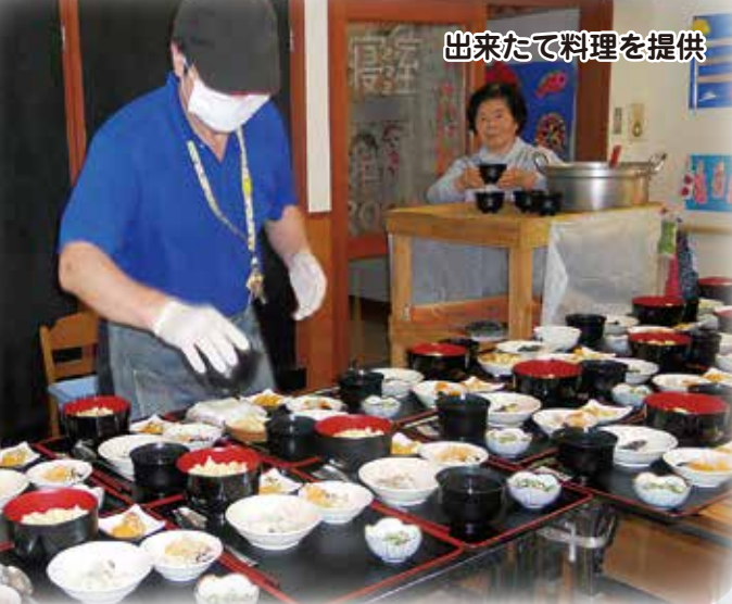
出来たて料理を提供