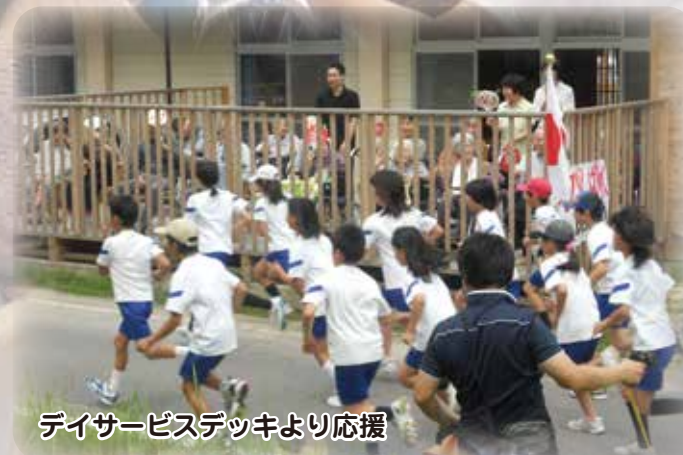
デイサービスデッキより応援