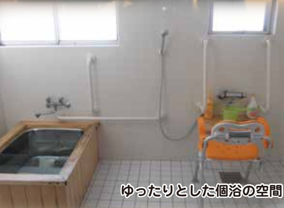
ゆったりとした個浴の空間