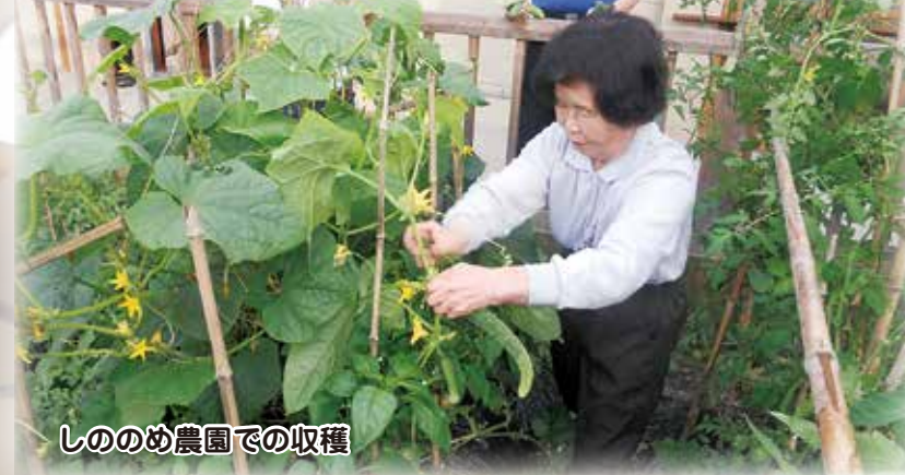
しのめ農園での収穫